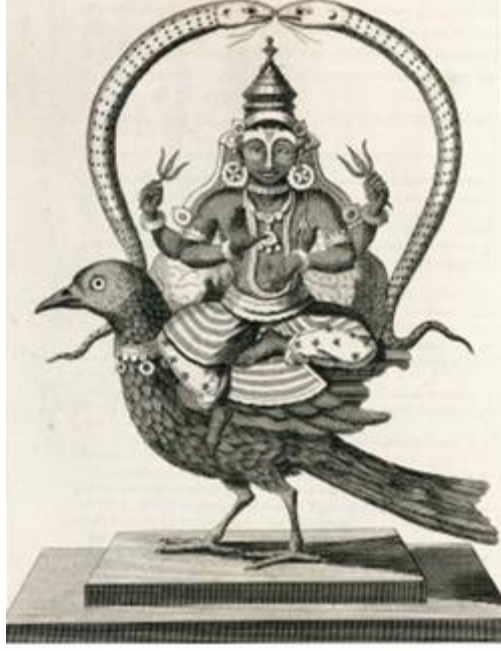
Shani on a black crow

చంద్రమానం ప్రకారం పక్షము రోజులలో పదమూడవ తిథి త్రయోదశి. నెలకు రెండు త్రయోదశి లుంటాయి. సంవత్సరానికి 12 త్రయోదశిలు. ఇందులో కొన్ని త్రయోదశిలకు హిందువులలో విశిష్టమైన ప్రాధాన్యత ఉంది. ఏ త్రయోదశి అయితే శనివారముతో కూడి ఉంటుందో ఆ రోజు శనిగ్రహాన్ని 'శనీశ్వరుడు'గా సంబోధిస్తారు. శని త్రయోదశి అంటే శనికి చాలా ఇష్టం. మూడు దోషాలను పోగొట్టి మానవులు కోరుకున్న యోగాన్ని అందించేవాడు శనీశ్వరుడు. నవగ్రహాలకు అధిపతి శనీశ్వరుడు. ఆయన పేరు చెప్తేనే భయపడతారందరూ. కానీ శనిత్రయోదశి నాడు శనైశ్వరుని భక్తితో కొలిచిన వారికి శుభాలనొసగుతాడని ఏలినాటి శని దశ' వారిని అంతగా బాధించదని పురాణాలూ చెబుతున్నాయి. శనయే క్రమతి సః నెమ్మదిగా చరించేవాడు శని అని పురాణోక్తి. శని గ్రహం సూర్యుని చుట్టు పరిభ్రమించేందుకు పట్టే కాలం 30 సంవత్సరాలు. అదే మన భూమి సూర్యుని చుట్టూ తిరిగేందుకు పట్టే కాలం 24 గంటలు . నత్ నెమ్మదిగా కదిలేవాడు కాబట్టి శనీశ్వరున్ని 'మండుడు' న్నారు మహర్షులు. నవ గ్రహాల్లో ఏడో వాడైన శనీశ్వరుడు జీవరాశులను సత్యమార్గంలో నడిపించేందుకే అవతరించాడని ప్రతీతి.